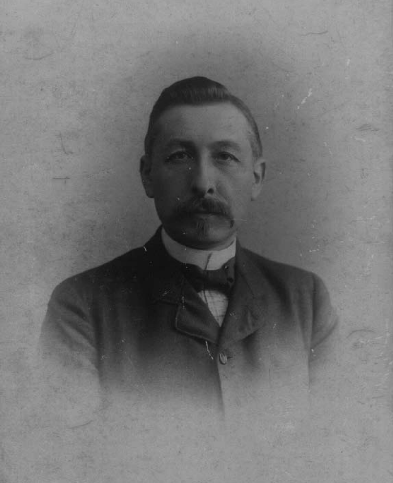
Pieter Jelles Troelstra,

en langdurig werk allen zoover te ontwikkelen, dat zij een eigen overtuiging en een eigen eerlijke blik op de werkelijkheid zouden krijgen. Nu is het uitstekend, dat de arbeiders ontwikkeld worden; maar de ervaring leert, dat als men met daden voor de arbeiders zo lang zou moeten wachten tot al de arbeiders, of een zeer belangrijk deel van hen tot eigen zelfstandige denkers zijn geworden, tot zij niet onder den indruk van den een of ander zich zelf al de groote problemen zouden hebben duidelijk gemaakt, dat men dan niet tot daden zou kunnen komen.