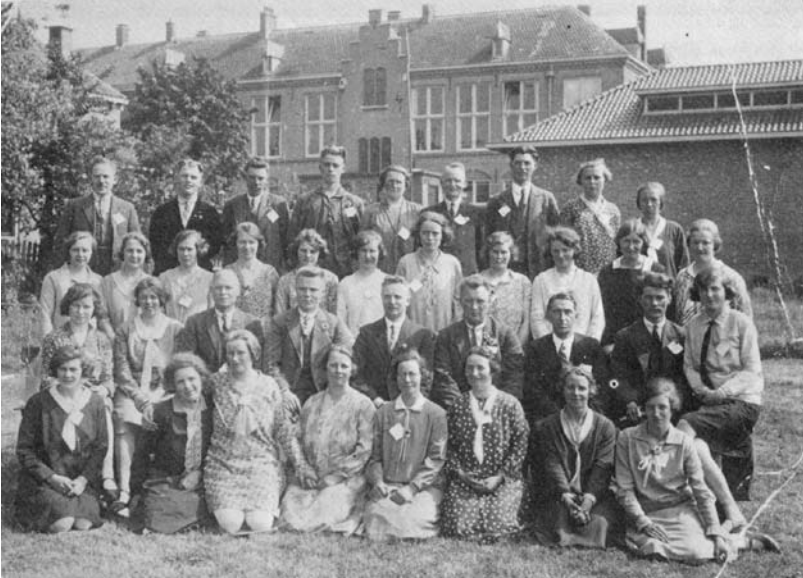
De arbeiderszangvereniging De Dageraad uit Drachten, waarin mijn beide grootouders zongen, was een belangrijk onderdeel van 'de rode familie'. Foto gemaakt bij gelegenheid van een van de zangconcoursen van de Bond van Arbeiderszangverenigingen.