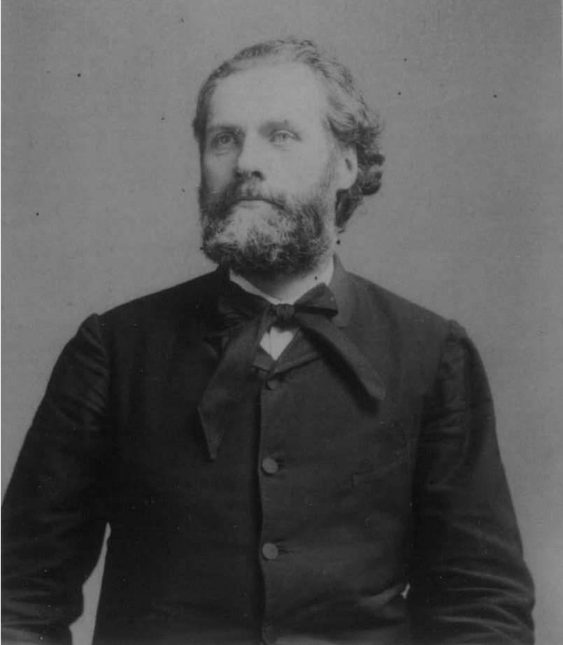
Portret van Ferdinand Domela Nieuwenhuis rond 1890.

de Eerste Internationale hadden opgericht. Bestudering van het werk van buitenlandse socialisten in de tweede helft van de jaren 1870 brachten hem verder op het pad van het socialisme. Radicale Amsterdamse werklieden trokken hem vervolgens helemaal de arbeidersbeweging in en mede door zijn met Recht voor Allen opgebouwd gezag zou hij weldra de woordvoerder van het toen nog piepjonge socialisme in Nederland worden. Een niet onbelangrijke factor daarbij was, dat de personen met wie hij vanaf die tijd te maken kreeg of voor wie hij schreef en sprak, tegen hem opzagen. Hij wist immers veel, kon zaken goed uitleggen en durfde dingen te zeggen. Enkelen in zijn naaste omgeving bleven Domela Nieuwenhuis als 'een heer' zien, maar de overgrote meerderheid bewonderde in hem juist de offers die hij had gebracht: de opgave van zijn predikantschap, zijn breuk met de