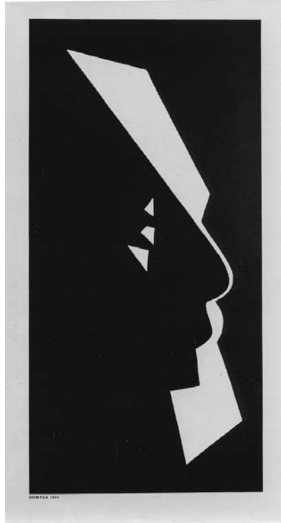
Een beeldmerk naar de bekende linoleumsnede van Cesar Domela met het karakteristieke portret van zijn vader Ferdinand Domela Nieuwenhuis uit 1923 siert de zijkant van Trippemaal in Gersloot (Museum Damshûs, Nij Beets).

martelaarschap zouden de belangrijkste kenmerken ervan zijn. ‘Schuldbesef, dat zich voor zijn bewustzijn omzet in verantwoordelijkheidsbesef voor het leed van anderen.’ 5 Zo zou, volgens Romein, Domela’s neiging om zichzelf geheel weg te cijferen in het belang van de zaak van de arbeiders, de sleutel tot het geheim van zijn wonderbaarlijke invloed op de massa zijn. Het was de vlam van de overtuiging bij Domela die mensen ertoe bracht hem als een heiland te zien.