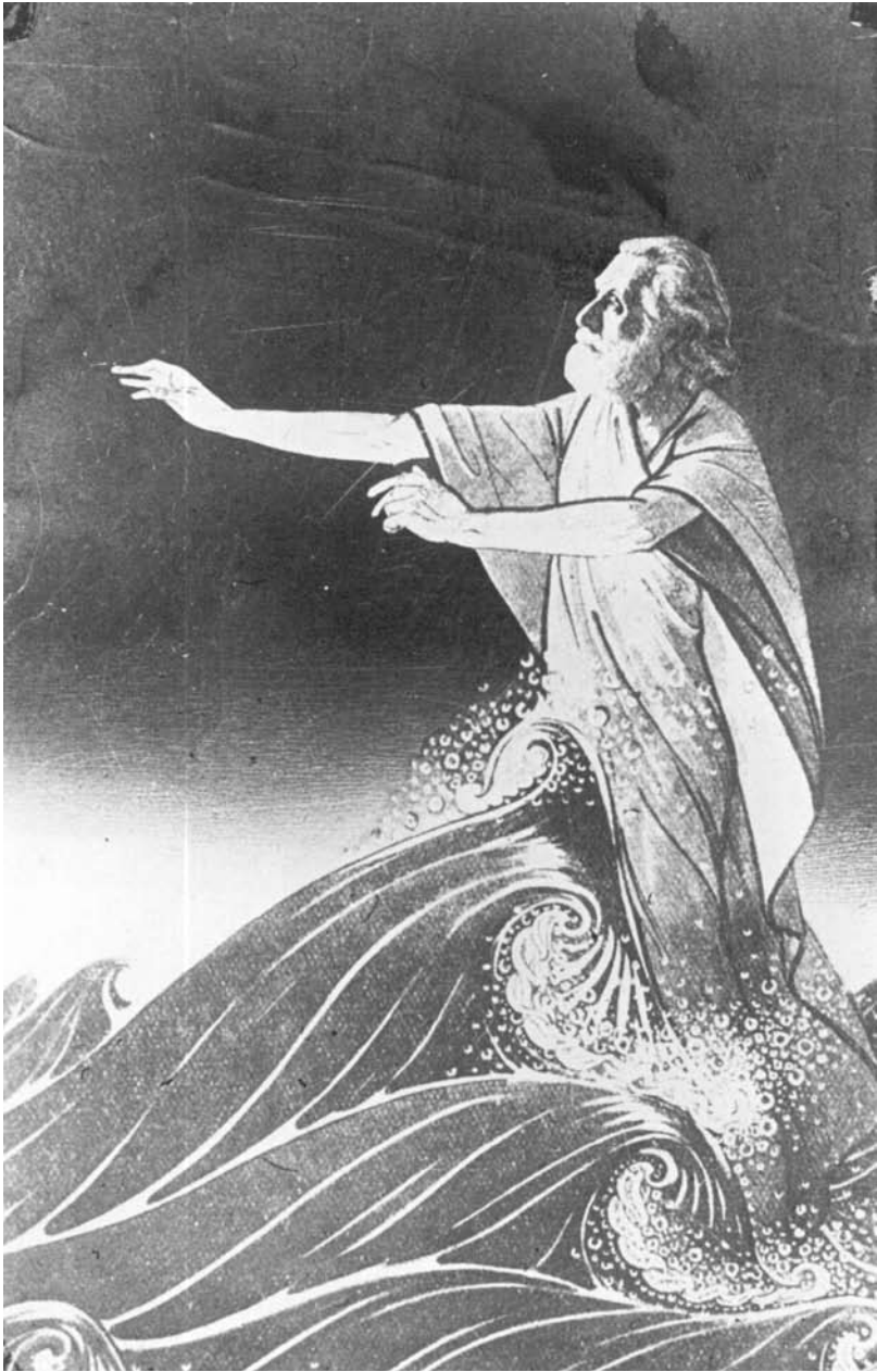
Domela als heiland. 'Als een rots in de branding van het leven, weerkaatsend het licht van den komenden dag'. Tekening van Willem Papenhuyzen voor het Gedenkboek dat Domela in 1916 werd aangeboden.