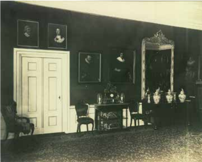
Afb. 9. In de zaal hingen de portretten van voorouders van de familie, geschilderd door bekende Friese meesters. Foto omstreeks 1898.

Achter de deur in de brede gevel bevonden zich de vestibule en de lange gang. Aan de oostkant van de laatste lagen de voorkamer en de zaal die via een “porte-brisée” met elkaar verbonden waren. Van deze vertrekken zijn foto’s bewaard gebleven. 7 In deze kamers hingen veel schilderijen, o.a. landschappen en zeestukken. Van enkele hiervan zijn de makers bekend. Het meest interessante voor de familiegeschiedenis is echter de aanwezigheid van een groot aantal familieportretten, die in de zaal en de achterkamer op de begane grond en in de trappenhal hingen. Zij dateerden uit de zeventiende, achttiende en negentiende eeuw en zijn vervaardigd door bekende Friese portretschilders zoals J. de Salle, W. de Geest en B. Accama en bekwame meesters uit Holland, zoals L.Volders, F.L. Hauck en J. Neumann.