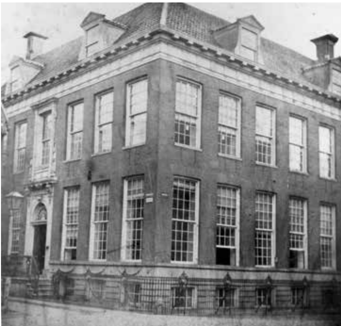
Afb. 5. Het Eysingahuis op de hoek van Turfmarkt en Koningstraat werd door verschillende leden van de familie bewoond tot 1880. Daarna werd hier het Fries Museum gevestigd.