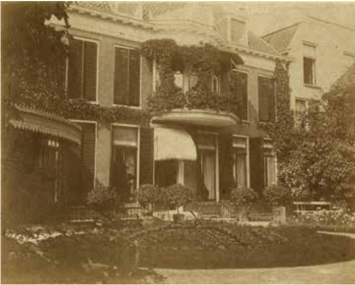
Afb. 14. De achtergevel van het Eysingahuis, met links de veranda. In de tuin is een verhoogd perk met bloemmozaïek aangelegd. Foto omstreeks 1890.