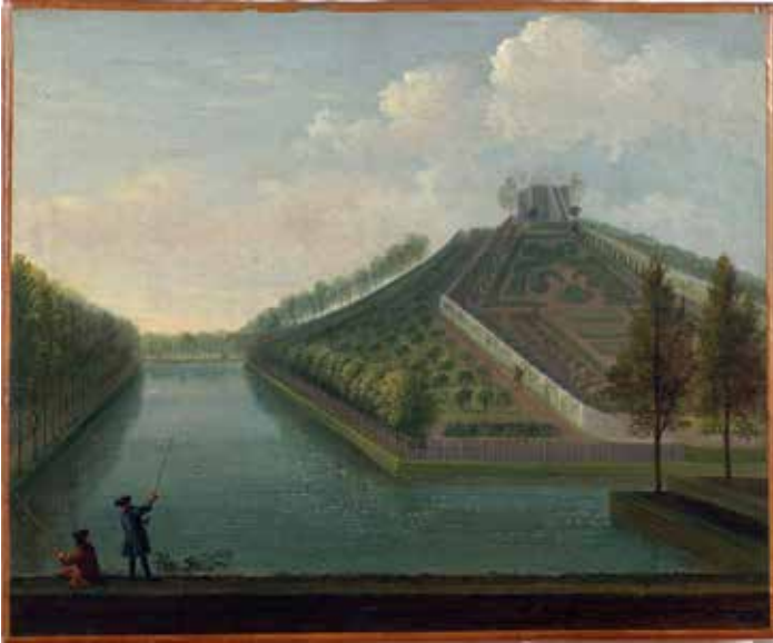
Afb.2. Gezicht op de berg met uitkijktoren van Heremastate, omstreeks 1730. Olieverf op doek (Particuliere verzameling).

en bomen. De vormgeving hiervan komt met de weergave op de andere afbeeldingen overeen. Het verschil is dat op het schilderij rondom de berg langs het water een hekwerk te zien is. Het valt op dat, evenals op de aquarel, op het schilderij ook een tuinman is weergegeven. Hier loopt hij langs het binnenhek naar boven. Het “grand canal” en de singel aan de westkant benadrukken de monumentaliteit van de tuin. Als stoffering zijn twee hengelende figuren aan het water afgebeeld.