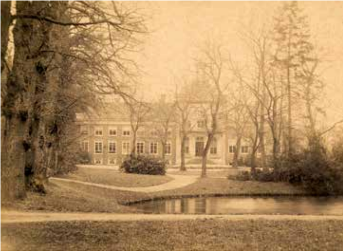
Afb. 4. Heremastate met de in landschapsstijl aangelegde tuin, gezien vanuit het zuiden. Foto omstreeks 1900.

De genoemde schilderijen en foto's leveren veel informatie op over deze monumentale buitenplaats, waarvan een deel van de oude Heremastate – nu onderdeel van het gemeentehuis van Skarsterlân – en de tuin met genoemde laan nog te bezoeken zijn.