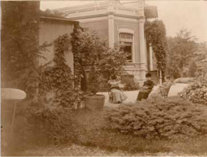
Afb. 17. In de voortuin van Boschoord stond links van het huis een prietel. Hier zijn de dochters van Frans Julius op een zomerse dag vereeuwigd. Foto vermoedelijk 1899 (Collectie Tresoar, Archief Van Eysinga-Vegilin van Claerbergen).

ons een blik op de voortuin. In het midden is een verhoogd perk met bloemenmozaïek te zien, net zoals dat het geval was achter het Eysingahuis te Leeuwarden. Aan weerszijden zijn boomgroepen geplant (afb. 18).