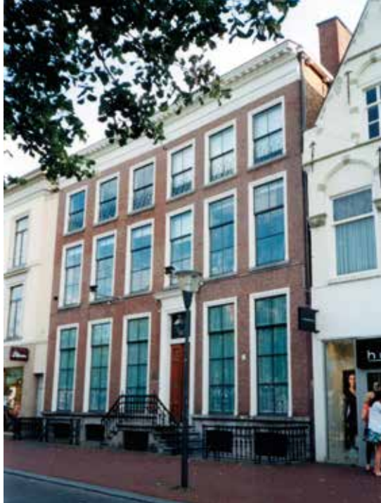
Afb. 3. Het Eysingahuis aan de Nieuwestad te Leeuwarden. Foto, 2008.

Voor het onderzoek naar de herkomst van het archief was het niet alleen nodig om informatie over de archiefvormers te achterhalen, maar ook om inzicht in de structuur ervan te krijgen. Dit hield verband met de aanwezigheid van de vele stukken van aanverwante adellijke en patricische families zoals Burmania, Heemstra, Humalda, Sminia en Vegilin van Claerbergen.