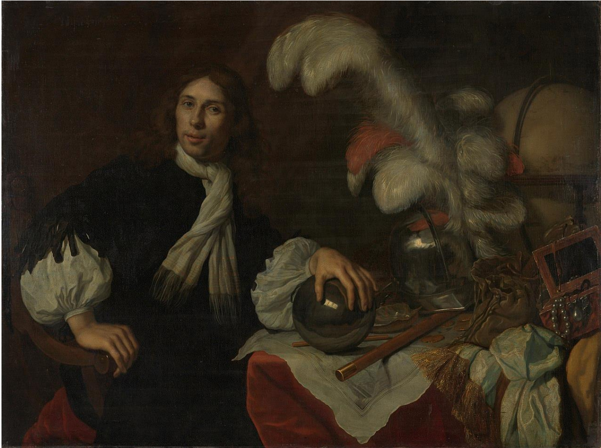
Postuum portret Auke Stellingwerff