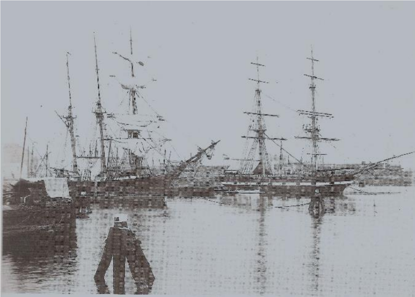
Stad Dockum als schoenerbark in Oosterdok Amsterdam ca. 1885; rechts de brik De Zeehond.