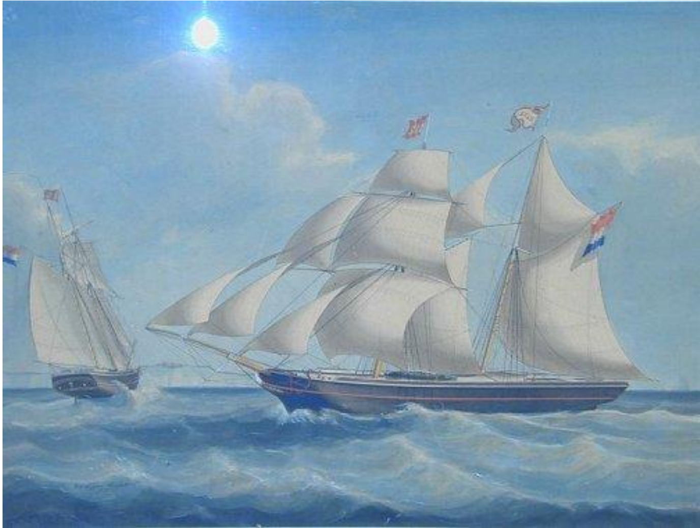
Teupken 1857, Scheepvaartmuseum Amsterdam