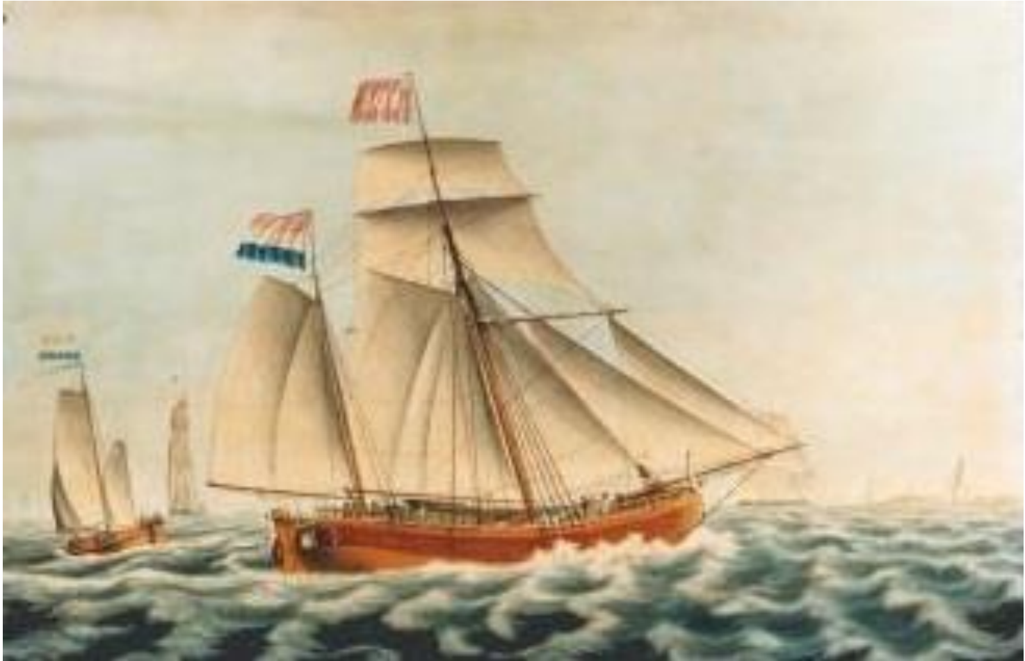
J. Spin ca. 1834, Noordelijk Scheepvaartmuseum Groningen