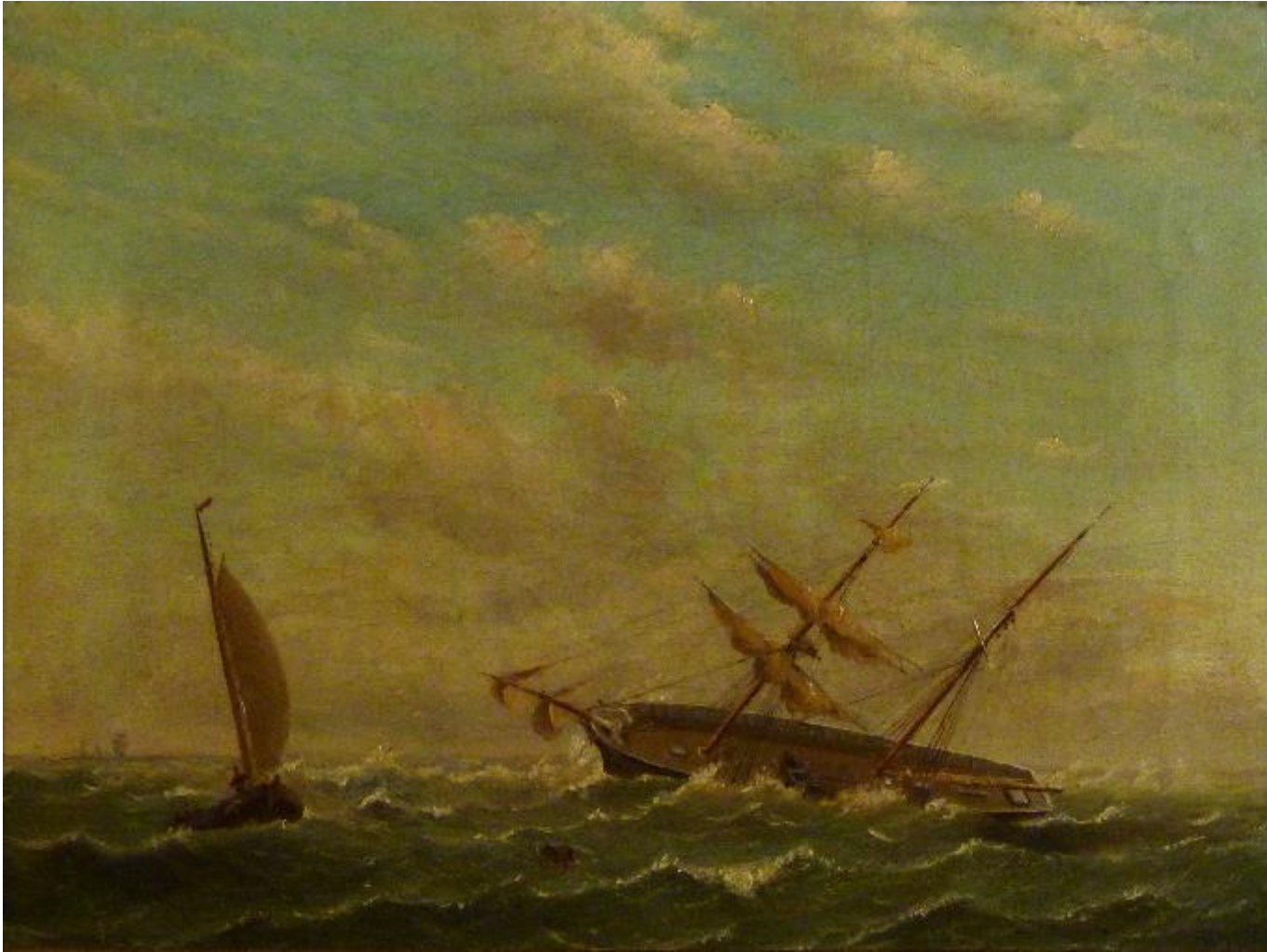
Gestrande Time is Money, Collectie Veenkoloniaal Museum Veendam.