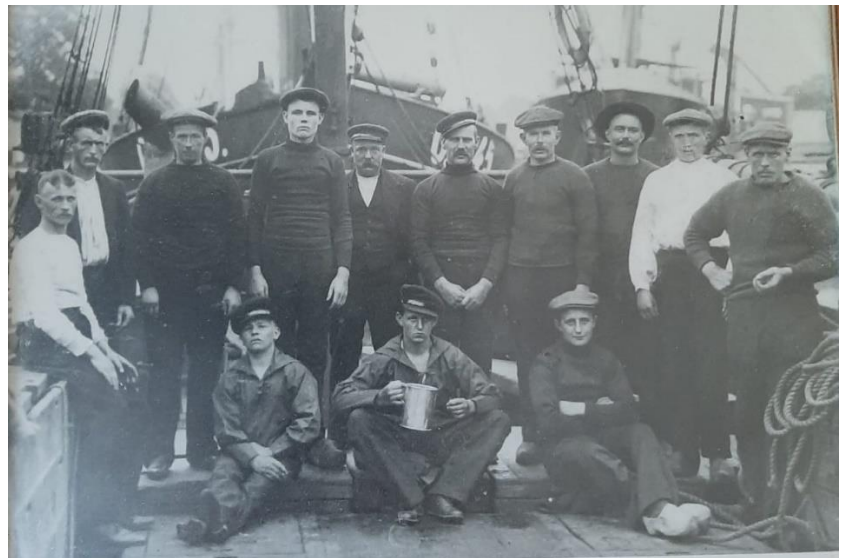
Bemanning van de Logger Louise.