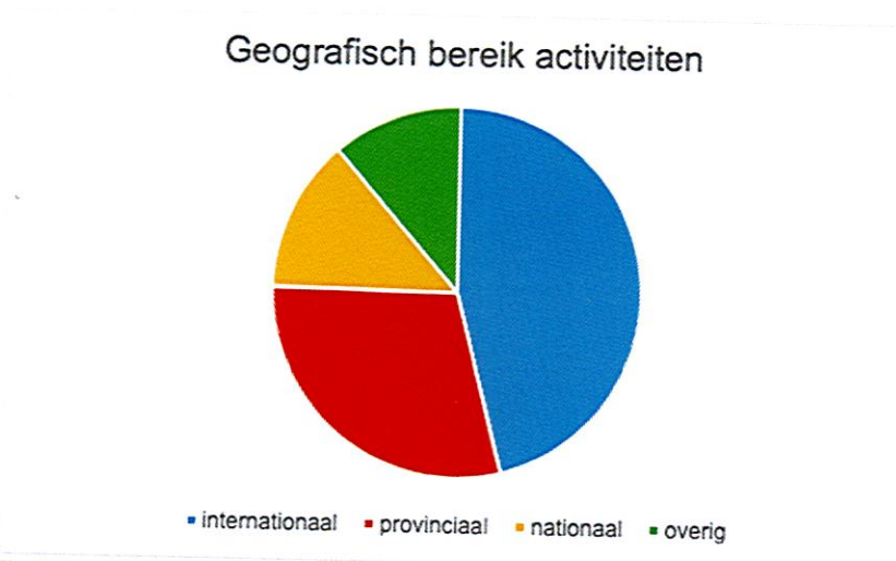
Figuer 4: Geografysk berik fan aktiviteiten fan Fryske Akademy meiwurkers

De klam lei yn it ôfrûne jier foar in grut part op wittenskiplike lêzingen en presintaasjes. Yn novimber hie nammentlik it suksesfolle Conference on Frisian Humanities (Ljouwert) plak mei mear as 70 paper- en posterpresintaasjes fan ûndersikers út binnen- en bûtenlân. Oer it generaal hie it kongres alle dagen yn trochsneed 80 besikers. Neist it mei-organisearjen fan it kongres, wie de Fryske Akademy boppedat goed fertsjintwurdige yn it oandiel oan wittenskiplike foardrachten en posterpresintaasjes.