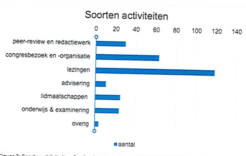
Figuer 3: Soarten aktiviteiten fan Fryske Akademy meiwurkers

It ôfrûne jier hawwe meiwurkers fan de Fryske Akademy yn totaal dielnaam oan 279 aktiviteiten. Dy aktiviteiten ha in ferskaat oan wittenskiplike en maatskiplike relevânsje, sa't yn Figuer 3 te sjen is.